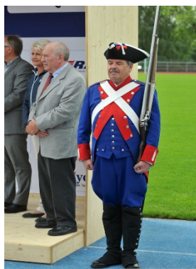
Remise des médailles

La Fédération européenne qui nous avait confié cette organisation ainsi que les 41 équipes participantes, record de participation, ont relevé la parfaite organisation de ces joutes avec un parcours à la hauteur d'un tel événement, une ligne d'arrivée digne d'un championnat du monde et surtout une sécurité sans faille assurée par la PCI.